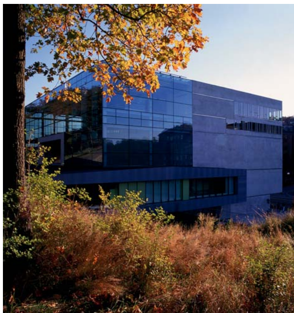
Världskulturmuseet i Göteborg

Den första nationella och europeiska konferensen inom tema asyl – Kommer någon fjärranfrån. Asyl- och flyktingmottagande i Sverige och Europa – genomfördes i oktober 2005 i samarbete med Världskulturmuseet i Göteborg. Konferensen innebar en bred och unik satsning på exponering av goda exempel och resultat från Equal (både från de nationella och transnationella partnerskapen) och ERF. Andra inslag var presentationer och analyser av system och policies inom asyl- och flyktingområdet på nationell och EU-nivå samt genomförande av ett antal forskarseminarier med deltagande från Sverige och andra medlemsstater. Konferensen gavs en konstnärlig och litterär inramning genom ett samarbete med den europeiska konstnärsgruppen significans , tidskriften Karavan och Göteborgs stadsteater . För ERF:s del innebar konferensen ett utmärkt tillfälle att lansera den nya programperioden; inom Equal fick de nya projekten en möjlighet att avisera sin kommande verksamhet medan projekten från första omgången redovisade slutresultat och goda exempel.