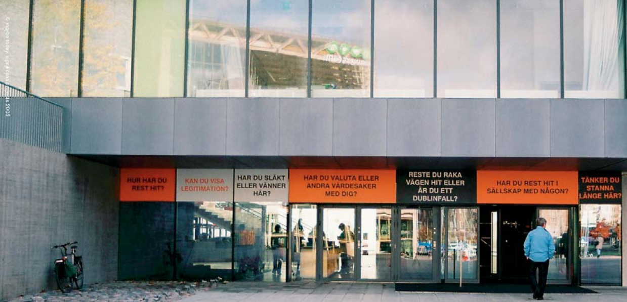
Konstnärsguppen significans installation på Världskulturmuseet i Göteborg